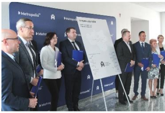
porozumienie 11 miast GZM z 20.05.2022 r.