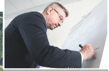
podpisuje Waldemar Bojarun, Wiceprezydent Katowic.